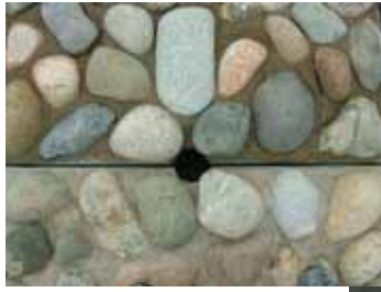
ブロック付合せ部