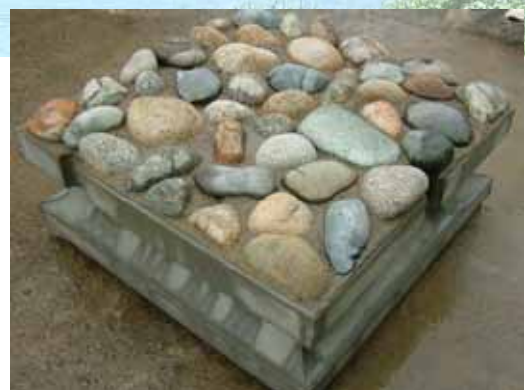
ジャカゴブロックの外観