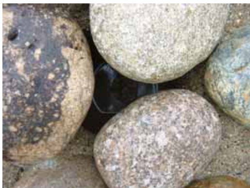
玉石隙間の魚巣口