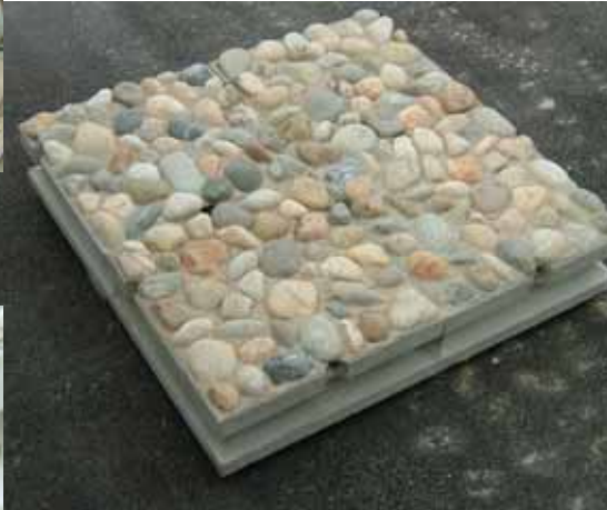
ジャカゴブロック連結時の外観