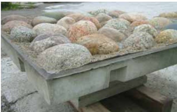
大型谷積みジャカゴブロック